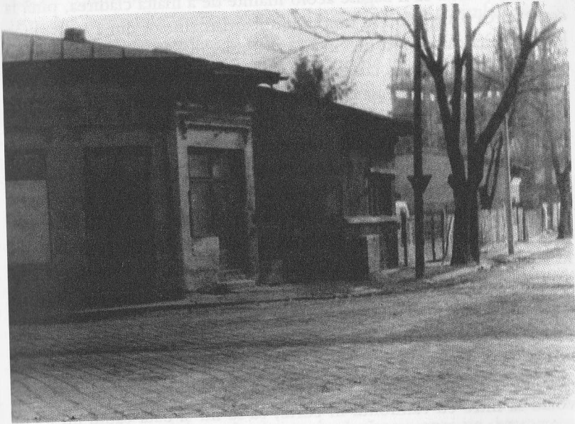
« Casa cea mare » de la intersecția străzilor Frunzei și Agricultori. Dincolo de ușile ferecate nu mai locuiește nimeni (1990).